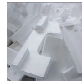
EPS VERPAKKINGEN EN EPS PRODUCTIEAFVAL