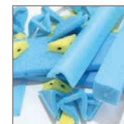
EPE (niet cross-linked) productie afval