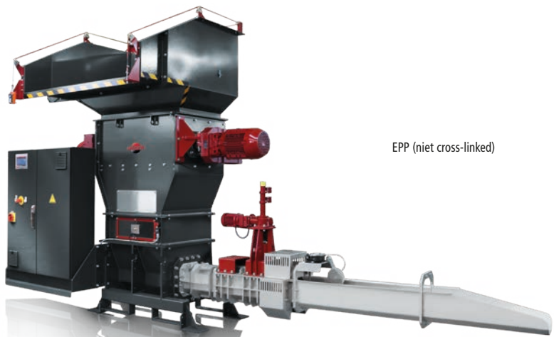
EPP (niet cross-linked)