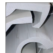
EPE (cross-linked) productieafval